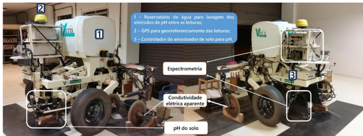
FIGURA 1. Plataforma multisensores de solo para aquisição de dados de condutividade elétrica, pH e espectroscopia de reflectância (Vis-NIR) do solo. Soil multisensor platform to collect data of electrical conductivity, soil pH and spectral reflectance (Vis-NIR).

MATERIAL E MÉTODOS: O planejamento e montagem da plataforma multisensores de solo (PMS) foi realizado no Laboratório de Agricultura de Precisão da ESALQ/USP, em Piracicaba-SP. Para tanto, foram utilizados os equipamentos comerciais Mobile Sensor Platform (MSP) e Vis-NIR Spectrophotometer, ambos da empresa Veris Technologies (Salina, KS, EUA). Desta maneira, foi possível utilizar três princípios físicos para levantamento de dados de solo, sendo: a) Elétrico: condutividade elétrica aparente do solo ( CE_a ); b) Eletroquímico: eletrodos íon seletivos (ISE) para determinar o pH do solo; c) Óptico: espectroscopia de reflectância no visível e infravermelho próximo (Vis-NIR) que está relacionada com uma série de atributos do solo. A plataforma com todos os sensores (PMS) utilizou a estrutura original da MSP onde foram adaptados e fixados os equipamentos para aquisição dos dados espectrais do solo (Figura 1).